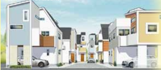
グリーンウォークアベニュー イーゼリアーズ

アリフェとは alley(アリー)=ひっそりとした隠れ家、コナ出会いの場 cafe(カフェ)=ヨーロッパのカフェをイメージ