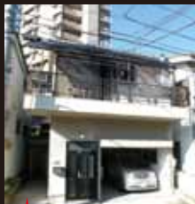
この奥が倉庫です (販売現地)