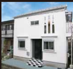
<写真は販売現地です>