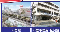
小岩駅 小岩事務所・区民館