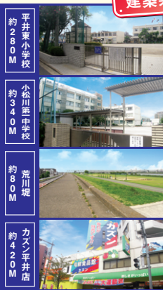
平井東小学校 約280M 小松川西中学校 約340M 荒川堤 約60M カスン平井店 約420M