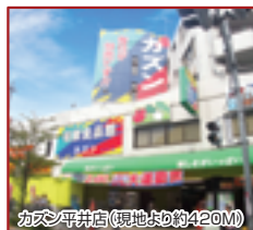
カオス平井店(現地より約420M)