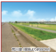
荒川堤(現地より約80M)