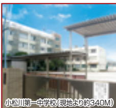
小松川第一中学校(現地より約340M)