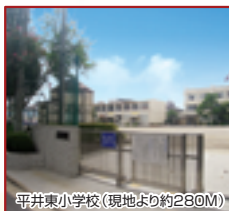
平井東小学校(現地より約280M)